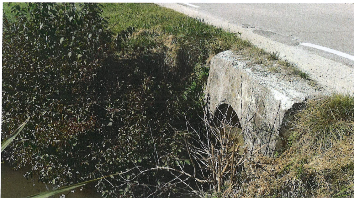
Slika 8: Cevni prepust v km 3+650