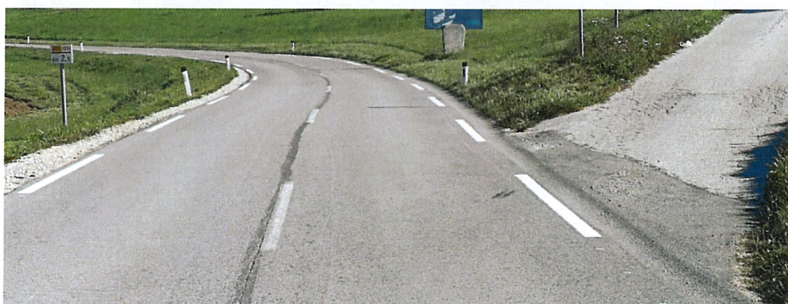
Slika 3: Priključek v km 2+500, kjer se priključi državna kolesarska steza