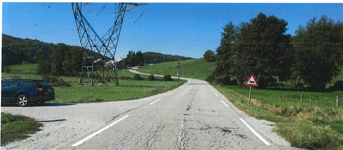
Slika 7: Levi priključek JP 681034 v km 3+545