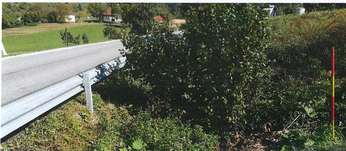
Slika 2: Prepust v km 2+230