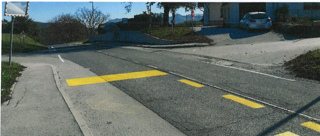
Slika 1: Začetek obravnavanega odseka v km 2+100